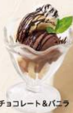
チョコレート&バニラ