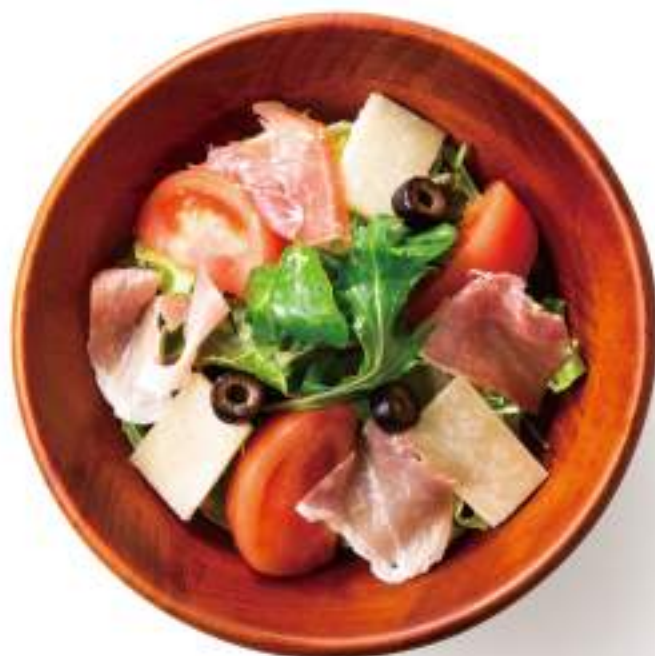
イタリアンサラダ ¥680(+税)