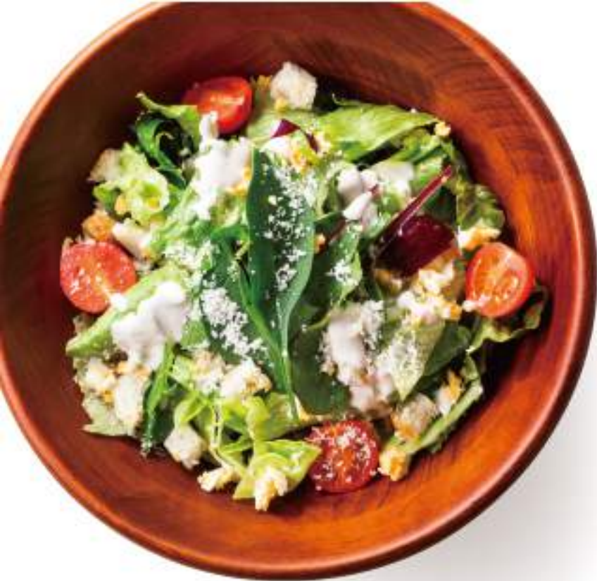
シーザーサラダ ¥580(+税)