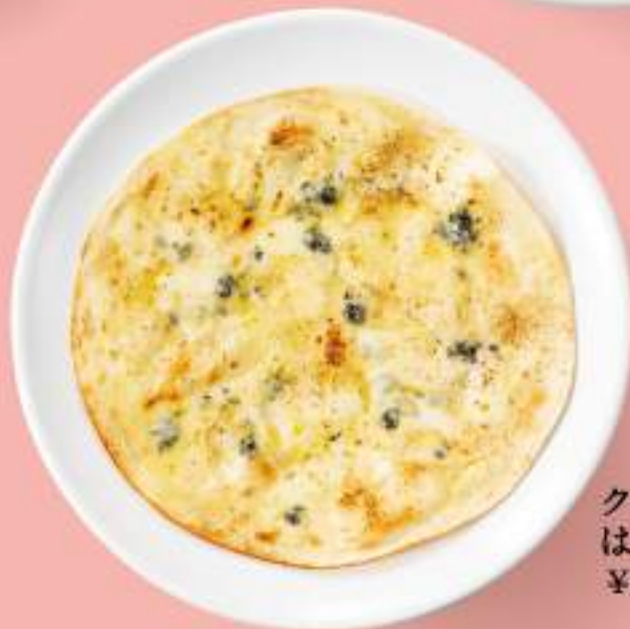
クアトロフォルマッジ はちみつ添え