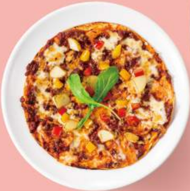
自家製ミートソースの ピッツァ