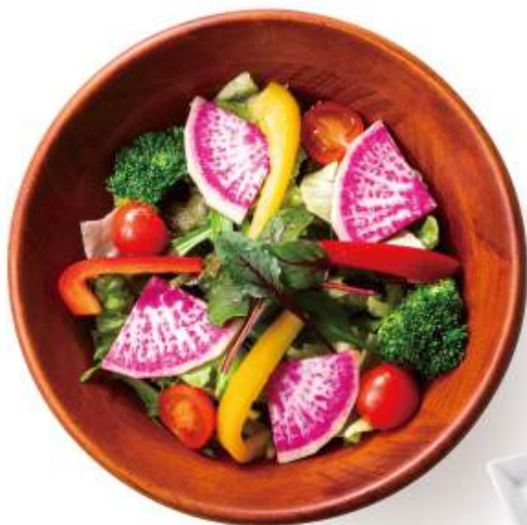
グリーンサラダ ¥580(+税)