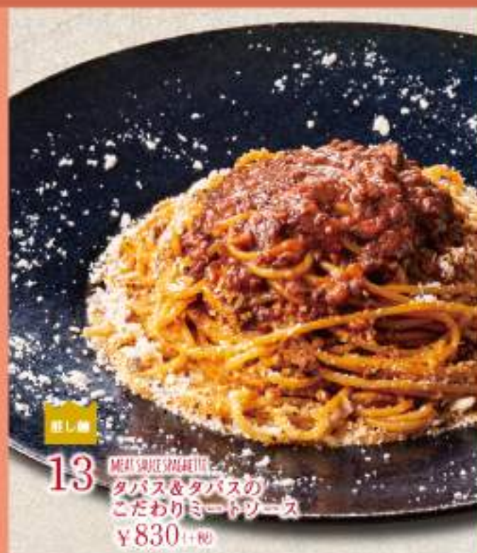
13 MEAT SAUCE SPAGHETTI タバス&タバスの こだわりミートソース ¥830(+税)