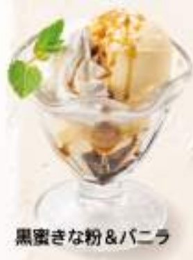
黒蜜きな粉&バニラ