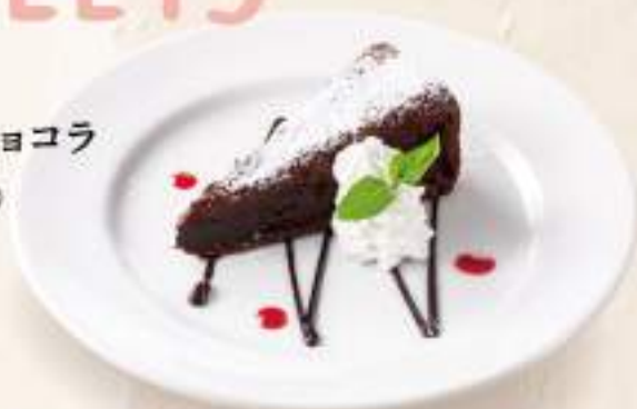
ガトーショコラ ¥300(+税)