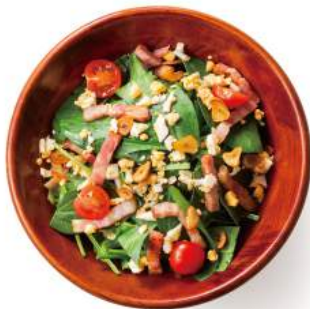
ベーコンとほうれん草のサラダ ¥680(+税)