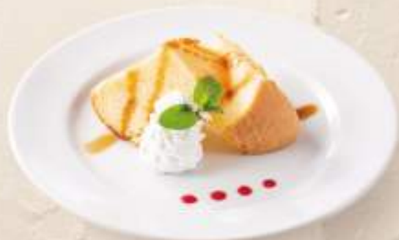
シフォンケーキ キャラメルソース ¥300(+税)