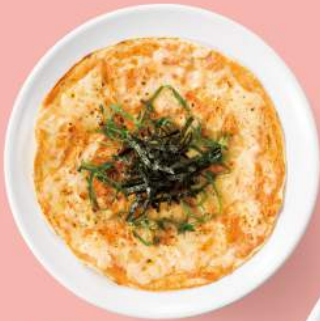
明太子と大葉のピッツァ