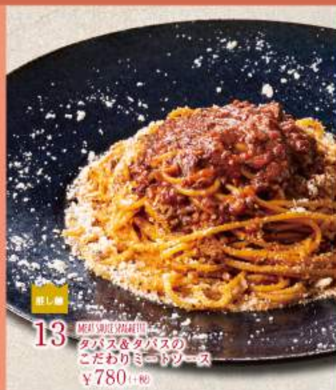
13 MEAT SAUCE SPAGHETTI タバス&タバスの こだわりミートソース ¥780(+税)